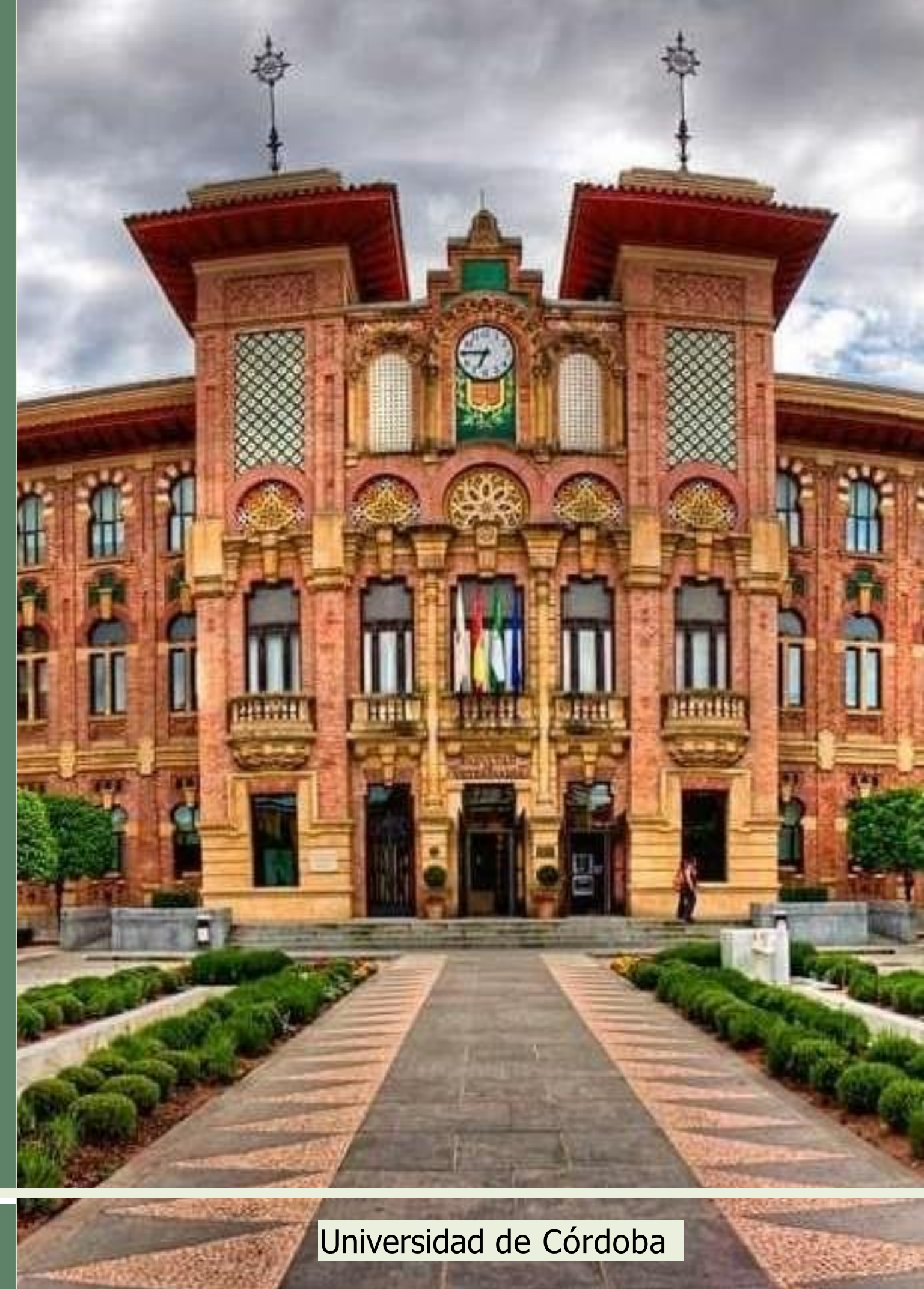
Universidad de Córdoba

➡ Svolgere ATTIVITÀ PROGRAMMATE nell'ambito dei dottorati di ricerca/master /scuole di specializzazione