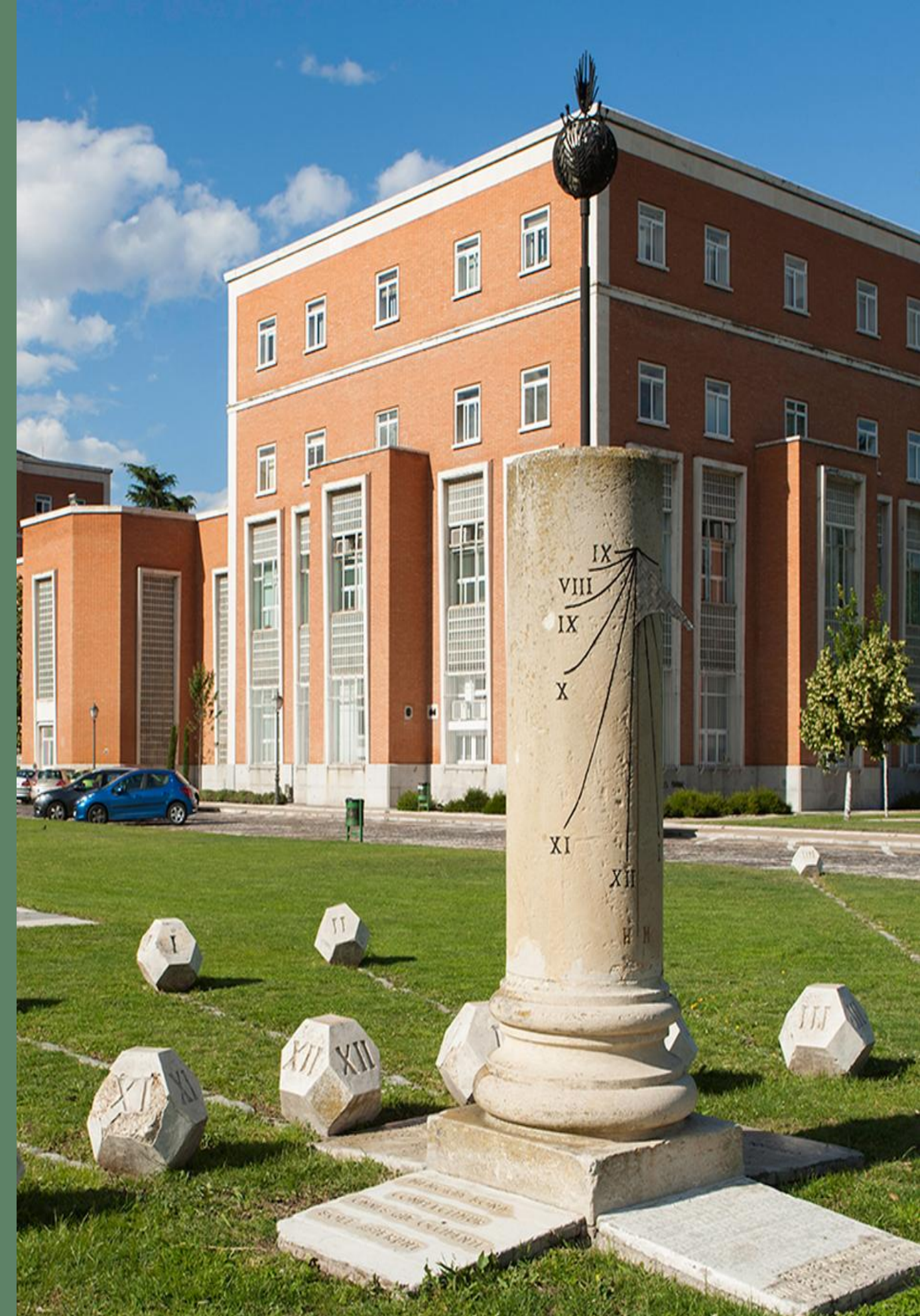
Universidad Politécnica de Madrid (UPM)