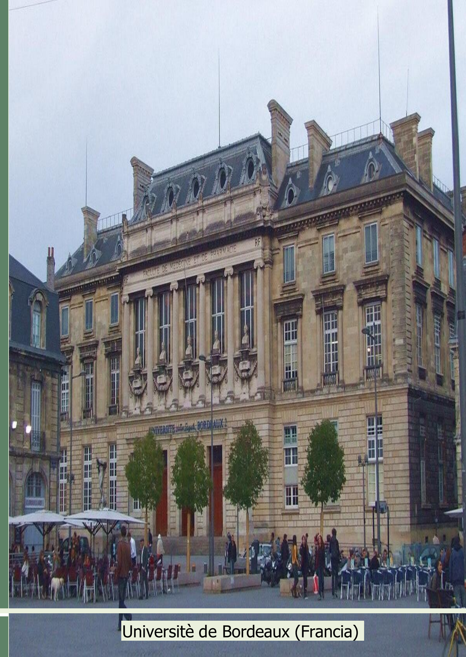
Université de Bordeaux (Francia)